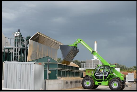
Teleskopstapler mit Schaufel im Einsatz (zusätzlich mit Arbeitsbühne verfügbar)