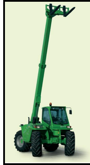
Teleskopstapler für Hubarbeiten